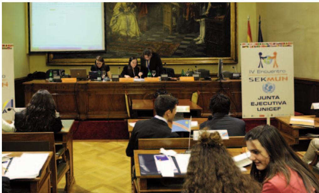
IV Encuentro SEKMUN. Junta Ejecutiva de Unicef.

El trabajo de la Junta está coordinado por el presidente y los vicepresidentes. Para facilitar el debate dentro de la Junta, la oficina de Unicef prepara un informe de cada tema del programa que es presentado por el Director Ejecutivo de Unicef.